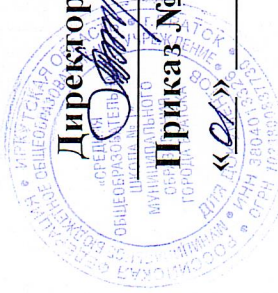
ГРАФИК РОДИТЕЛЬСКОГО КОНТРОЛЯ ОРГАНИЗАЦИИ ПИТАНИЯ В СТОЛОВОЙ МБОУ «СОШ №1» НА ПЕРВОЕ ПОЛУГОДИЕ 2024-2025 УЧЕБНОГО ГОДА